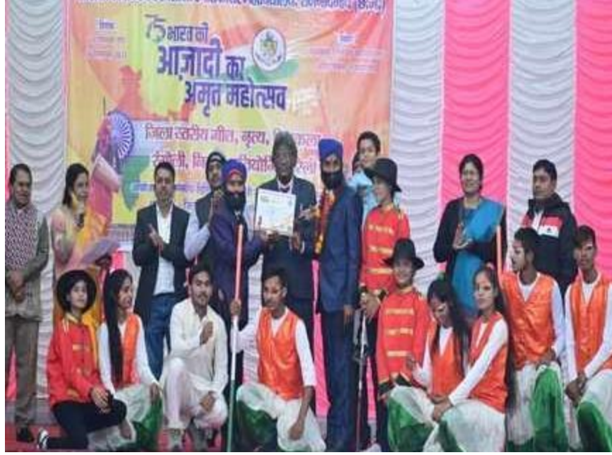
“अमृत महोत्सव’ जिला स्तरीय गायन एवं नृत्य प्रतियोगिता संपन्न