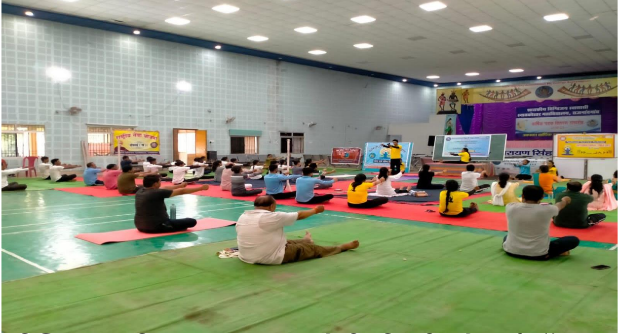
दिग्विजय महाविद्यालय राजनांदगांव में तीन दिवसीय योग वर्कशॉप का हुआ समापन।