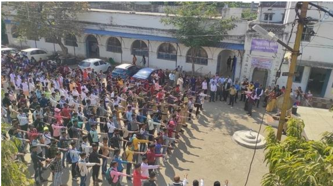
दिग्विजय महाविद्यालय में हुआ संविधान की प्रस्तावना का पाठन