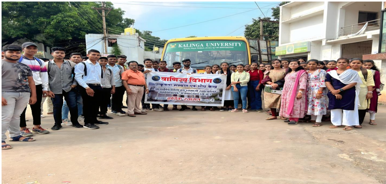
One workshop on Personal Interview and Group Discussion Under The M. O. U. Activity Organized by Kalinga University