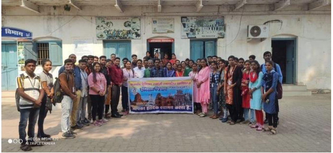
इतिहास विभाग में शिक्षक - अभिभावक सम्मेलन का आयोजन