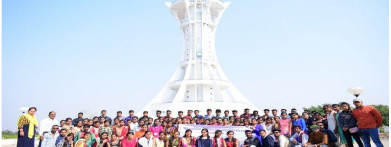
“युवा इतिहासकारों ने प्राचीन नगरी को देखें, समझे इतिहास के महत्व”