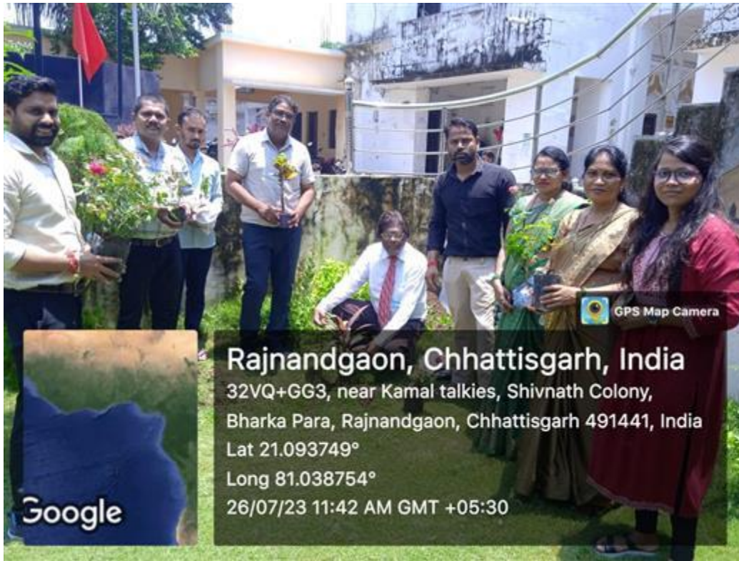
Plantation in Office Garden