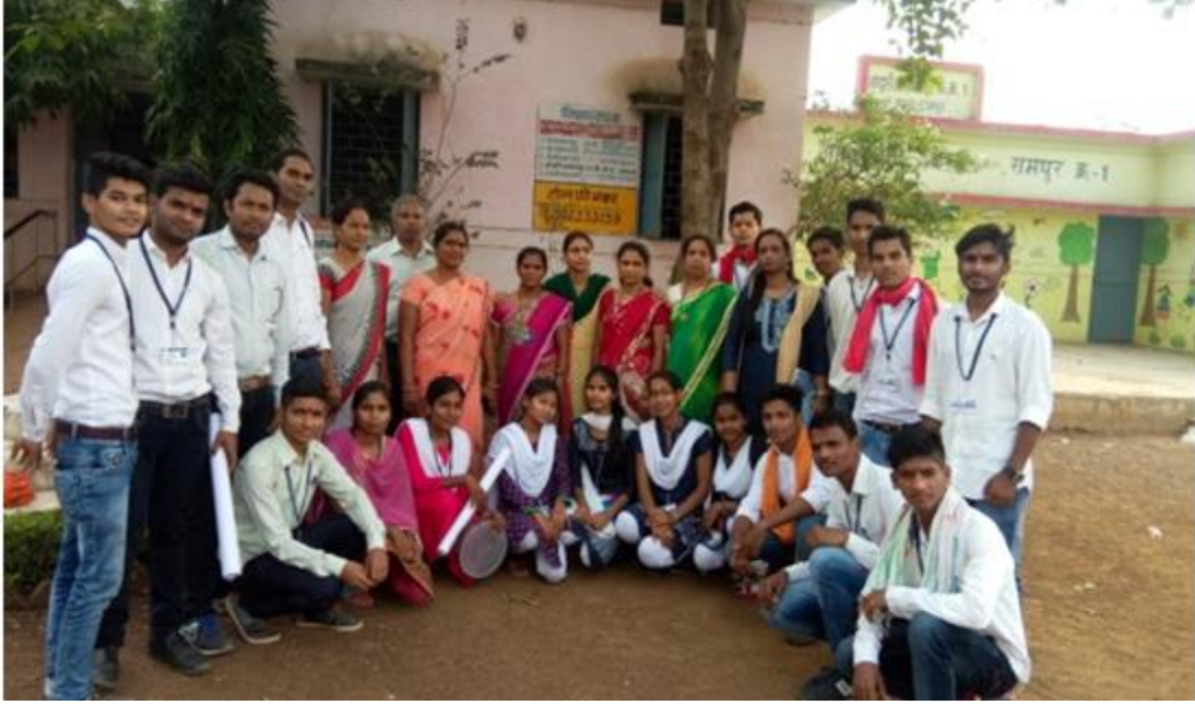
विस्तार गतिविधि के अंतर्गत – नशामुक्ति, स्वच्छता व दहेज प्रथा पर नुक्कड़ नाटक व प्रोजेक्टर प्रदर्शन