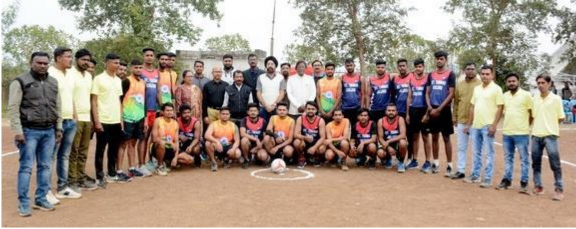
दिग्विजय महाविद्यालय ने जीता अंतर महाविद्यालयीन नैटबाल (पुरुष) प्रतियोगिता