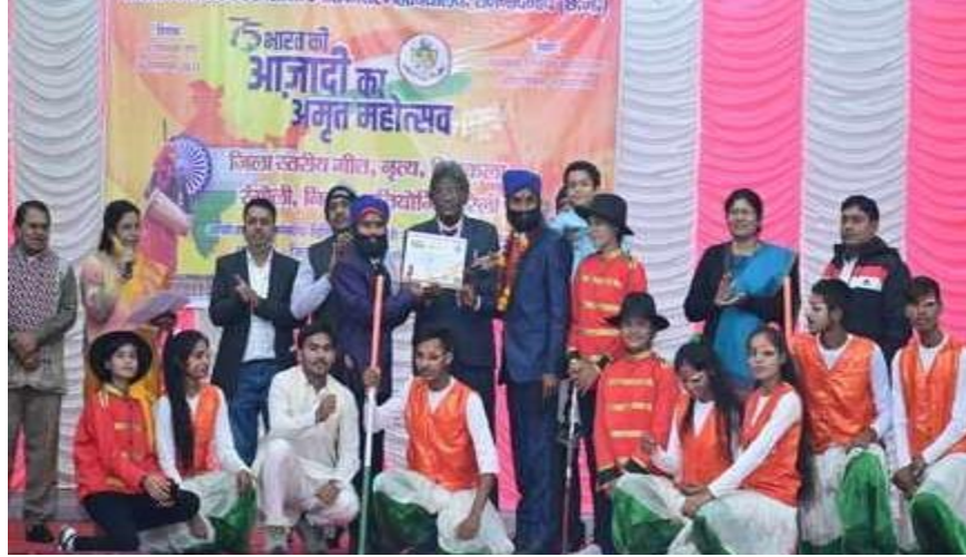
“अमृत महोत्सव” जिला स्तरीय गायन एवं नृत्य प्रतियोगिता संपन्न