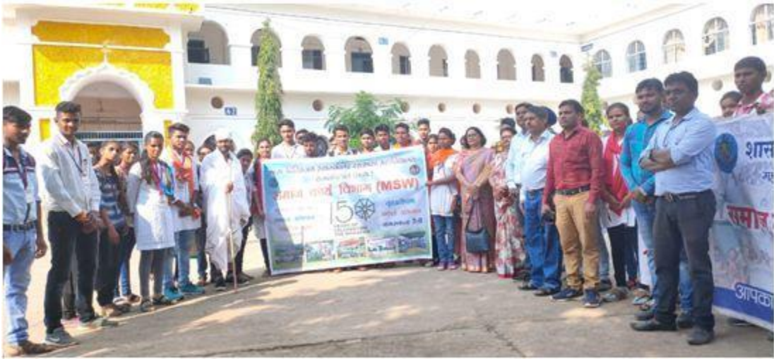
समाजकार्य विभाग द्वारा स्वच्छता अभियान