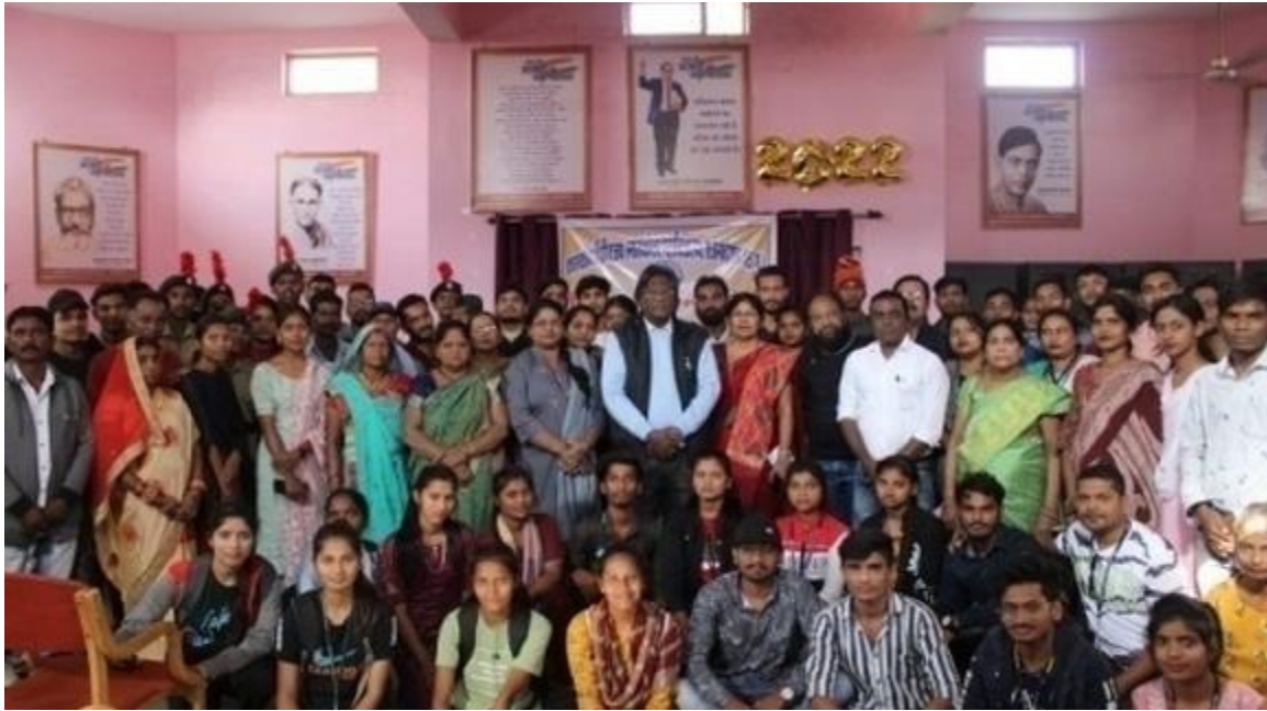
पत्रकारिता विभाग में शिक्षक - अभिभावक सम्मेलन आयोजित