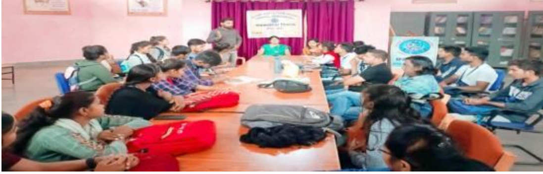
देश की उपलब्धि को दर्शा