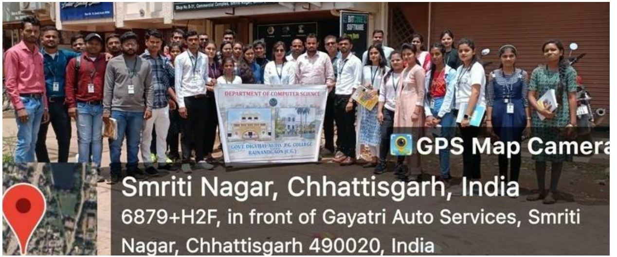
ऍमओयू के अंतर्गत बिट कोड सॉफ्टवेयर कंपनी का भ्रमण